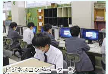
ビジネスコンピューター部