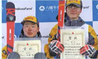
スキー部アルペン